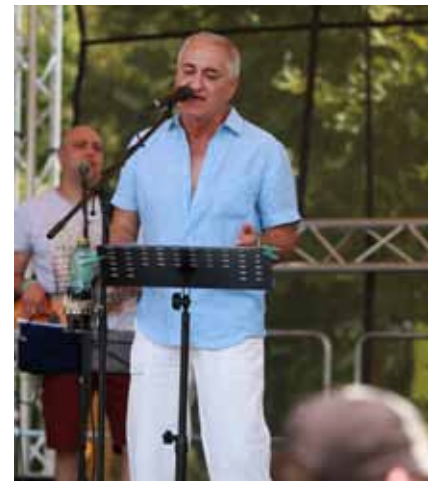
Druhý den. Hudební program na Štěrkovišti pokračoval i v neděli. Návštěvníci si mohli poslechnout vystoupení kapel (zleva) Apoa, Září či Joe Cocker Forever.