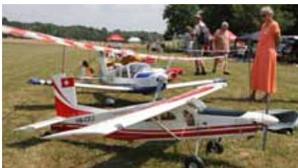
Jako skutečné. Součástí doprovodného programu byla přehlídka leteckých modelů na Bělově.