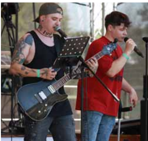
Exhalace. V úvodu sobotního programu vystoupila skvělá kapela Exhalace z Jalubí.