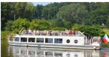
Pohoda na vodě. Víkendové dny si lidé mohli zpříjemnit plavbou po Baťově kanálu.