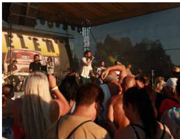
Publikum. Do krásného areálu Štěrkoviště přišlo během prvního dne bezmála dva tisíce lidí, kteří si vystoupení všech účastníků užívali.