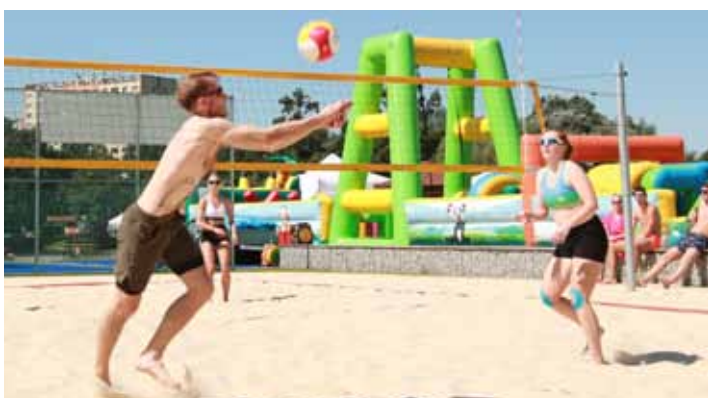
Na pláži. Extrémní teploty byly velkou zkouškou i pro účastníky beachvolejbalového turnaje, který byl také součástí Otrokovických letních slavností.