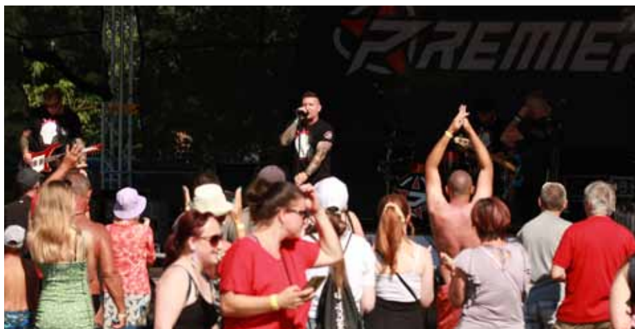
Premier. Zlínská kapela Premier dokázala i přes panující vedro roztancovat své fanoušky.