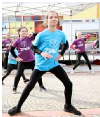
Tanec. Dopolední část zahájily děti z DDM Sluničko zumbou a vystoupily i mažoretky.