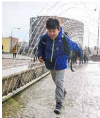
Jarní sprška. Závěr odpoledne patřil slavnostnímu spuštění fontány.