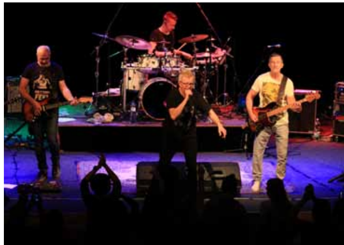
Energičtí. Mňága to na BESEDĚ pořádně rozjela.