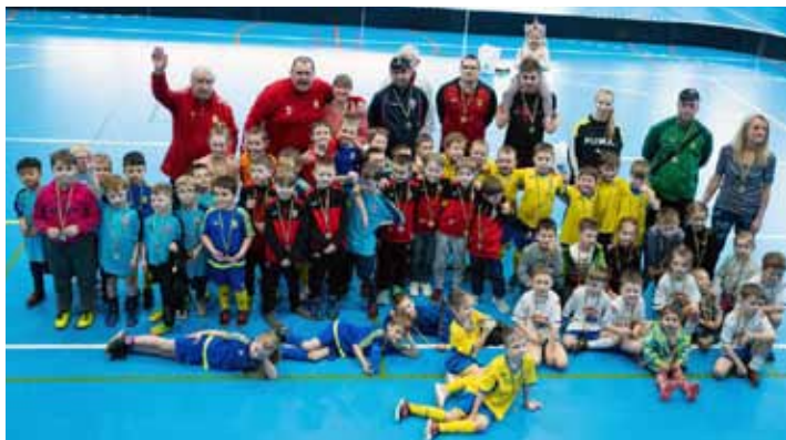
Vyhráli všichni. V tomto klání se na počet gólů nehrálo.

Šest regionálních týmů se mezi sebou utkalo v neděli 20. března v Městské sportovní hale, kde se konal turnaj v minifotbale pro předpřipravky. Mimo domácí, kteří díky své bohaté základně do bojů vyslali hned dvě mužstva, se v turnaji představili benjamínci týmů FC Malenovice, FK Mladcová, SK Louky a Ajaxu Bezměrov.