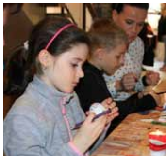
Malované. Jarní dílny DDM Sluničko nabízely výrobu velikonočního zajíce nebo tradiční kraslice.