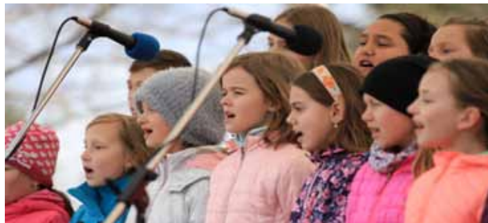
Zpěvem. O pěveckou vložku se postarali žáci ZŠ Mánesova a ZŠ Trávníky.