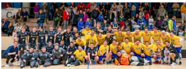
Pomohli. Zápas skončil nerozhodně 10:10.