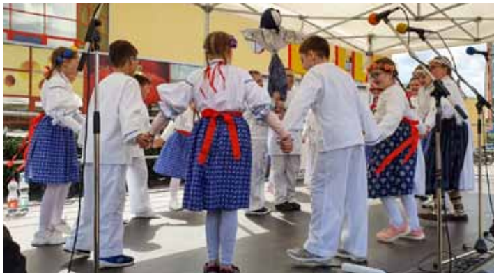
V kole. Odpolední program zahájily děti ze ZŠ T. G. Masaryka, které předvedly tradiční vlnění Morany.