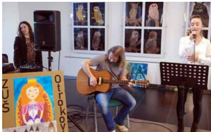
V Barumu. Slavnostní vernisáž se uskutečnila 23. března.

Vestibul Continental Barumu, s. r. o., zdobí od konce března výtvarné práce žáků otrokovické základní umělecké školy. Výstava tam potrvá až do konce ledna příštího roku.