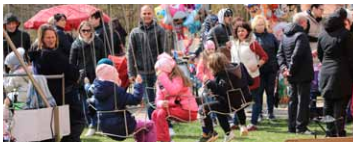
Atrakce. Myslelo se i na nejmenší. K dispozici byl řetězový kolotoč a skákací hrad.