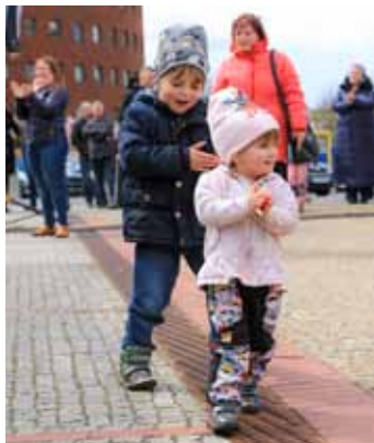
Radost. Hudební vystoupení bavilo nejenom dospělé, ale i nejmenší diváky.