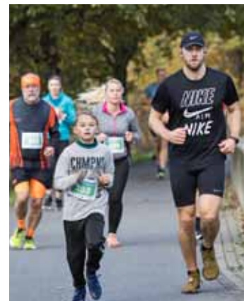
Spolu. Závodů se mohou zúčastnit běžci nejrůznějších věkových kategorií.