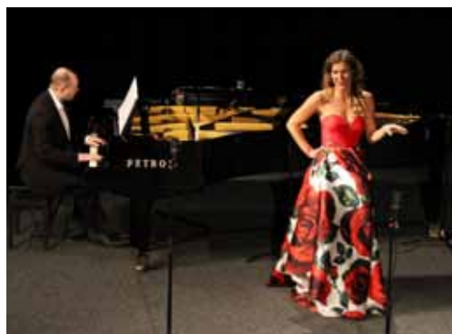
Koncert. Po předání ocenění se diváci mohli nechat unášet tóny skvělých zahraničních umělců při koncertě MUSICIANA.