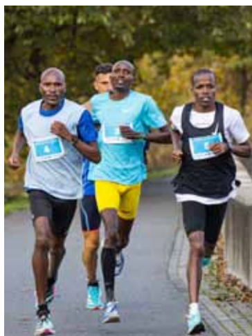
Trojice. Letošních závodů, které nesly název Sít'21 Běžecký festival Otrokovice 2023, se také účastnilo několik zahraničních hostů, včetně běžců z Keni (na snímku, Izraele, Slovenska, Moldavska, Ukrajiny i Kanady).