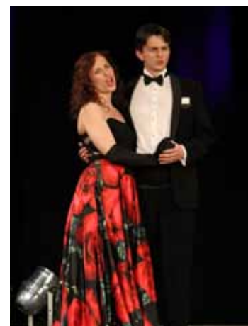
Spolu. Během koncertu zazněly slavné operní, operetní a muzikálové melodie.