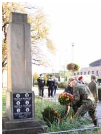
Uctění památky. Výročí vzniku samostatného Československa si město každoročně připomíná pietním aktem u pomníku obětem 1. světové války.