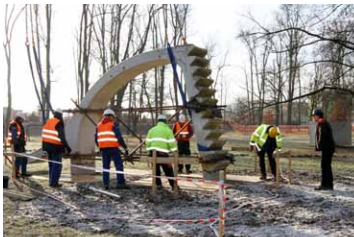
Nové místo. Skluzavka stojí na betonovém podstavci.