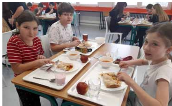
Tradiční mexická. Školáci mohli také ochutnat plněnou tortillu a mexickou polévku.