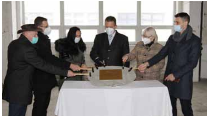
Poklepání. Zahájení stavby se ujali zástupci kraje, města i záchranky.