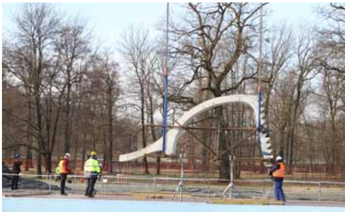
Přesun. Dvoutunovou skluzavku zvedal speciální těžkotonážní jeřáb.