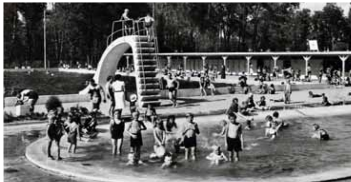
Boťa. Skluzavka má připomínat tvar dámského střevíčku.

Dvě tuny vážící skluzavku, která stála desítky let na Městském koupališti Otrokovice, se podařilo přesunout na její nové místo. Chlubou koupaliště bude i nadále. Z čestného místa bude připomínat baťovský odkaz.