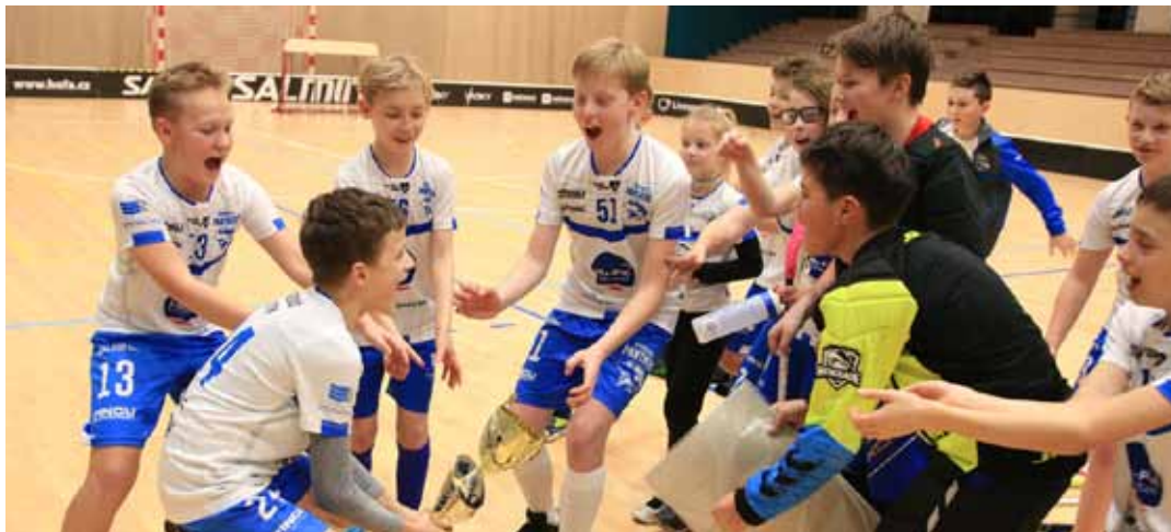
Čistá radost. Finálový zápas s Vítkovci byl až do poslední vteřiny napínavý. O vítězi rozhodly až nájezdy.