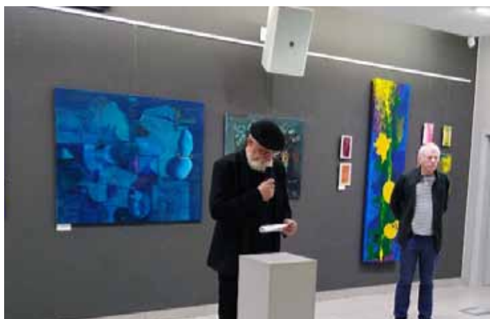
Vernisáž. K vidění jsou malby, tisky, kresby i fotografie.