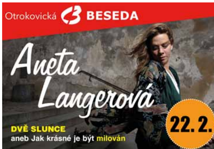
Nejenom zpěvačka. Aneta Langerová představí v Otrokovicích album Dvě slunce .

Pro mě je důležité získat novou inspiraci, nechat nápady dozrát, čekat, až si samy řeknou o pozornost a v tu chvíli vím, že nastal ten správný čas. Když vydám nové album, velký prostor dostanou samotné koncerty. Živé hraní nás baví, jezdíme pak několik let od města k městu a vyprávíme nové příběhy. Po čase začnou nové nápa-