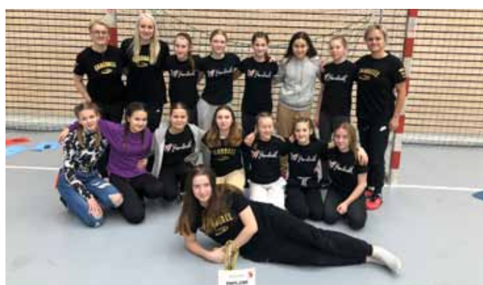
Pohár. Pravidelné tréninky se děvčatům vyplatily.