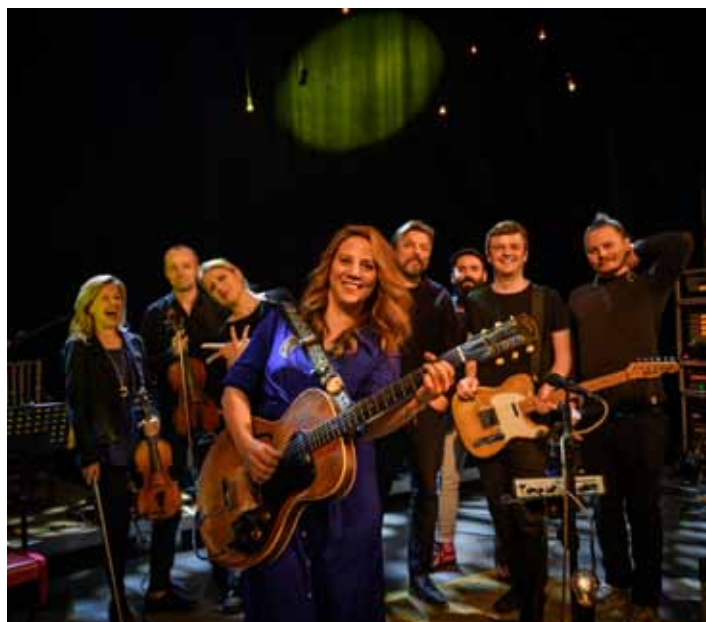
S kapelou. Návštěvníci koncertu se mohou těšit na zajímavý akustický zážitek.