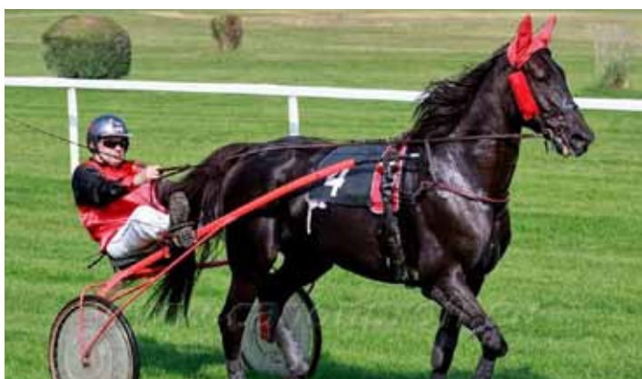
Spolu. Z dvanácti startů získali sedm umístění.