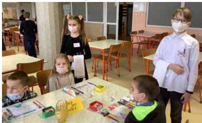
Jako v restauraci. Prvňáčci obsloužili jejich starší spolužáky.

„Až budeš chodit do školy, teta ředitelka ti dá slabikář.“ Důležitý hovor s tímto sdělením vedla doma se svým mladším bratrem, předškolákem, jedna z našich prvňáček. Ze slabikáře, který dostali jako překvapení, měli totiž prvňáčci opravdovou radost.