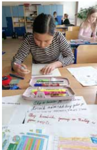
Dopisy. Otrokovičtí školáci získali nové kamarády.

Napsat dopis nebo pohled. To je dovednost, kterou už umí málokterý školák. A právě to se rozhodli změnit ve družině ZŠ T. G. Masaryka, která navázala kontakty se školou v Chrudimi. Žáci 6. oddělení na