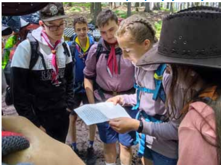
Na výpravě. Skauti podnikají během celého roku nejrůznější zajímavé výpravy.