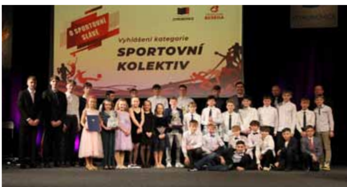
Oceněné kolektivy. Za své výkony získali ocenění veslaři, družstvo dorostenců a starších žáků, tým gymnastického aerobiku 9–11 let a vítězem této kategorie se stali elévové z Panthers Otrokovice.