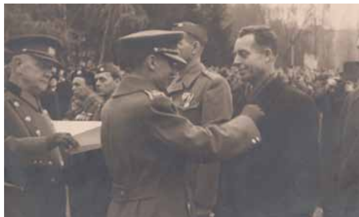
Uznání prezidenta Československé republiky pro pana Bohuslava Gottwalda.