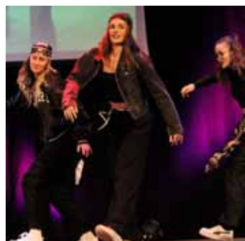
Vystoupení. Příjemným zpestřením večera bylo akrobatické vystoupení Acro yoga a taneční kapely Beat Up Zlín.