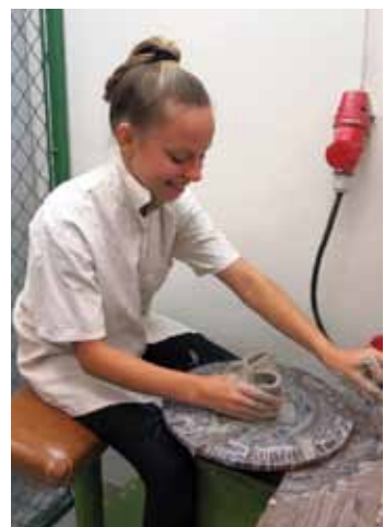
S hlínou. Výtvarníci pracují s různými druhy materiálu.