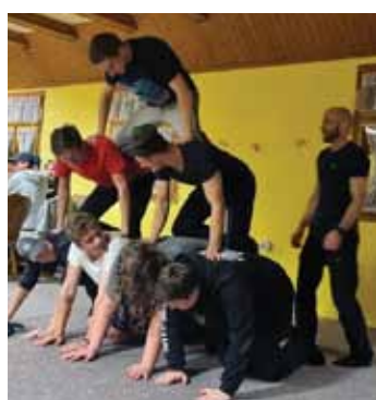
Nespadne? Během aktivit se studenti rozhodně nenudili.

V týdnu od 8. do 10. listopadu jsme vyrazili do areálu Ikaria Břežůvky. Naštěstí nám přálo i počasí, a tak jsme většinu času trávili v přírodě. Realizované aktivity, při kterých bylo využíváno zážitkové pedagogiky, byly zaměřeny na zvlá-