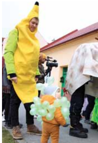
Vitaminy. Fantazii se meze nekladou. Mezi tradičními kostýmy se objevil například i banán a hrozen.