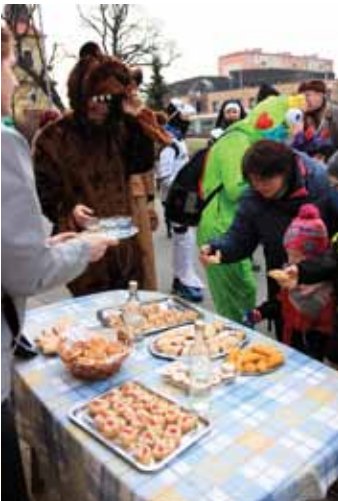
Pohoštění. Koláčky, chlebičky, jednohubky, ale i slivovice – lidé masopustní koledníky náležitě pohostili.