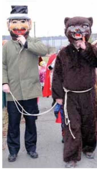
Tradiční masky. V čele každého průvodu nesmí chybět medvěd s medvědářem.