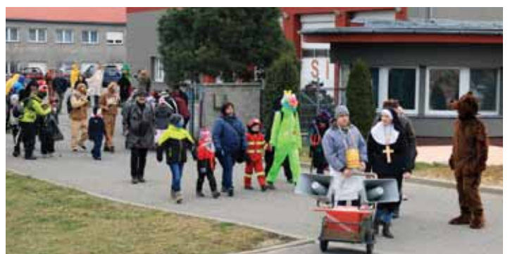
Průvod. Druhý masopustní průvod vyrazil od hasičské zbrojnice v centru města.