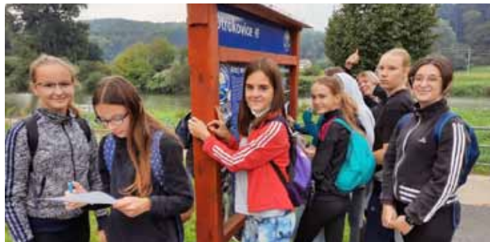
Kolektiv. Školu navštěvuje více než 400 žáků.