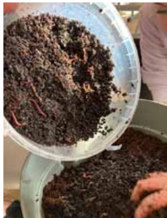
Ekologicky. Žížaly produkují hnojivo, které je využíváno na nové školní zahradě.

Nedílnou součástí základního vzdělávání jsou i okruhy týkající se aktuálních problémů světa, ke kterým bezesporu patří i témata ekologická a environmentální. Jejich zařazování do výuky je příležitostí pro rozvoj osobnosti žáků hlavně v oblasti postojů a hodnot.