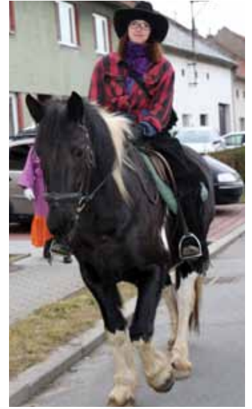
Živý. Netradiční atrakcí v Kvítkovicích byl opravdový kůň.