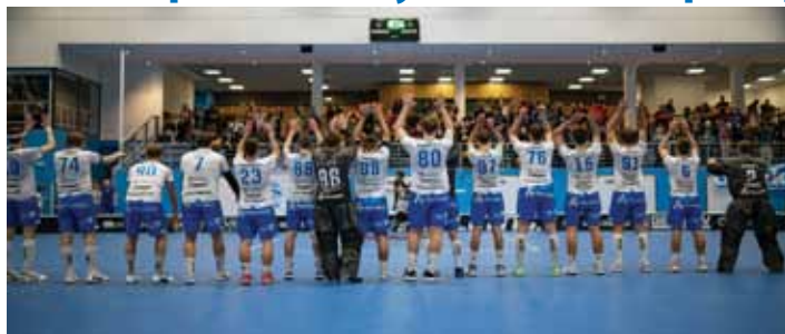
Poděkování. Panteři se se svými fanoušky náležitě rozloučili.

„Tlak byl obrovský. Když jsem přebíral, tak jsem měl pět hráčů. Neměli jsme pomalu na čem stavět. Oslovil jsem 54 lidí, zajímavé hráče,