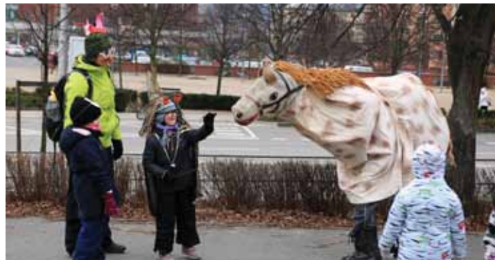
Nekouše? Otrokovická kobyla sice nebyla pravá, ale zato hodně rozverná.