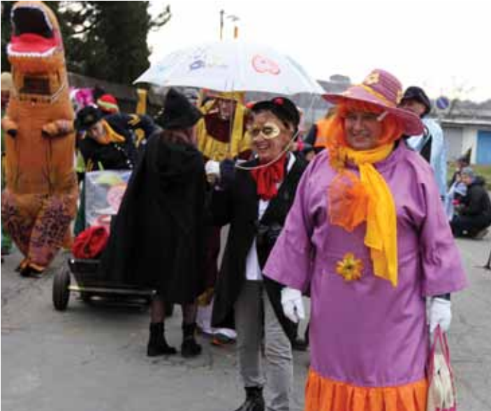
S veselou. Na kvítkovické fašankáře čekala obchůzka celou čtvrtí.