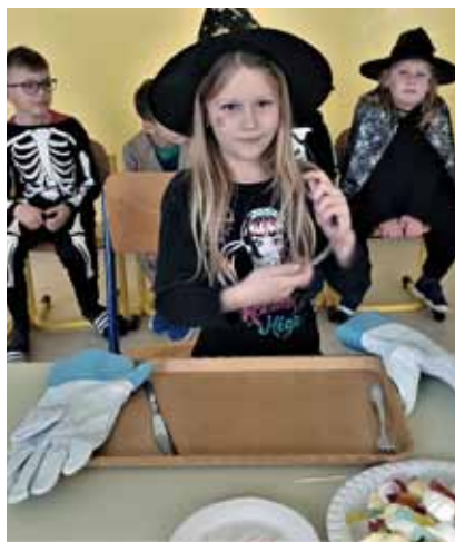
Čarodějnice školou povinné. Strašidly se to hemžilo také na chodbách ZŠ Trávníky. Halloweenská tematika provázela děti nejenom během vyučování, ale především v rámci družiny, kde na ně čekala celá řada soutěží, ale také sladkých odměn.