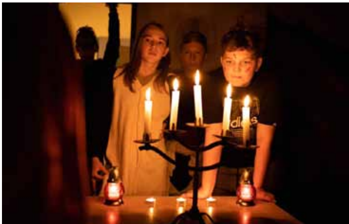
Jednou v roce sám sebou. Když slunce zapadá, smích ďábla chodbami zní... Aznějí i během nocování na středisku Trávníky DDM Sluníčko.