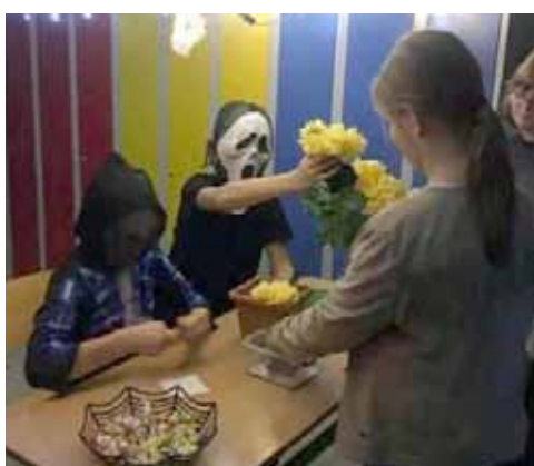
Bojíte se? Strašidly, kostlivci, duchy i čarodějnicemi se to hemžilo i na ZŠ T. G. Masaryka. Halloweenem se prolínala také celá výuka. Dětem se tato netradiční výuka, která se točila kolem dýní, netopýřů a dobrot velmi líbila. A ti nejodvážnější se mohli ve večerních hodinách vydat do školy na halloweenskou stezku.