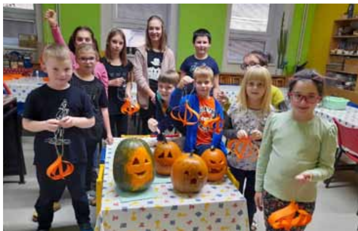
Zručné. Tradiční dlabání dýní patří k oblíbenému podzimnímu tvoření. Toho se pečlivě zhostily děti z kroužku kreativního tvoření DDM Sluníčko ve středisku Tlumačov.