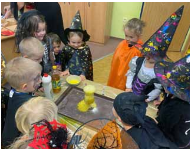
Čary máry! K Halloweenu patří nejenom kouzla, ale také čarodějné lektvary. Ty vařily děti otrokovické mateřské školy na pracovišti K. H. Máchy.