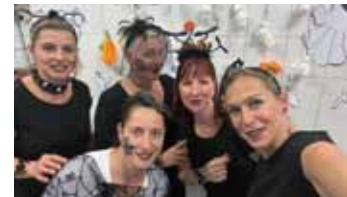
Strašidelná Máneska. Skvělá halloweenská nálada panovala i na ZŠ Mánesova. V kostýmech přišly nejenom děti, ale také velká část pedagogického sboru, včetně kuchařek. A například devátáci si pro své mladší spolužáky připravili pořádný Halloween Hunt.