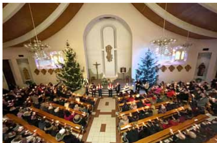
Sváteční. Krásnou sváteční atmosféru plnou vánočních melodií zažili lidé, kteří zavítali 28. prosince do kostela sv. Vojtěcha na vánoční koncert Andělé nám nad dědinou.