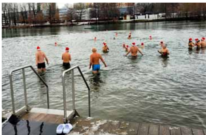
Santíci. Plavky a santovská čepice, nebo kulich – to bylo to jediné, co měli otrokovičtí otužilci na sobě na Štědrý den ve chvíli, kdy vstoupili do Štěrkoviště, které mělo tři stupně Celsia.