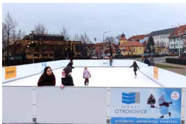
Na bruslích. Pro milovníky bruslení bylo i na přelomu loňského a letošního roku k dispozici na náměstí 3. května umělé kluziště, které mohli využít zcela zdarma.