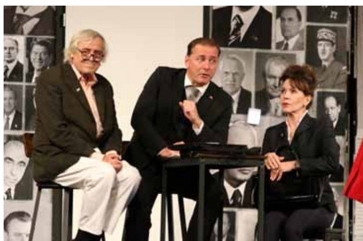
Vánoční divadlo. Posledním představením roku 2023 se stala divadelní komedie Presidenti , která nabídla neúprosný pohled do zákulisí politiky.