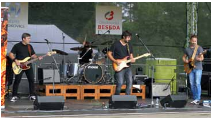
Rozjezd. Třetí ročník Michalfestu odstartovala zlínská pop-rocková kapela Září.