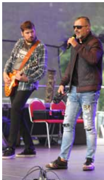
Energičtí. Závěr Michalské pouti patřil domácím i světovým hitům rocku, které předvedlo seskupení Best of Rock.