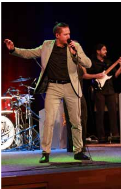
Nejenom k poslechu. Úžasnou hudební show, která roztancovala nejednoho návštěvníka, předvedla ve středu 27. září skupina The People .