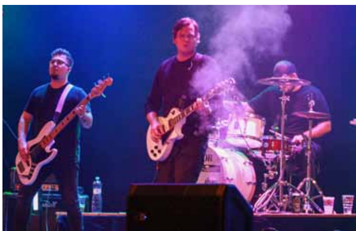
Party. Páteční večer byl určený pro všechny milovníky pop-rockové muziky. Ve velkém sále Otrokovické BESEDY se konalo vystoupení dvou kapel – Minami a Infinity .