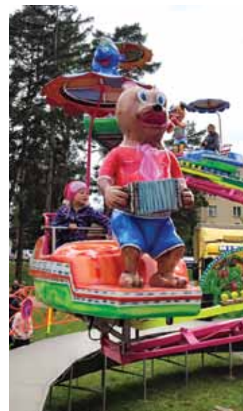
Oblíbená atrakce. Na žádné pouti nesmí chybět kolotoče či oblíbené „labuť“.