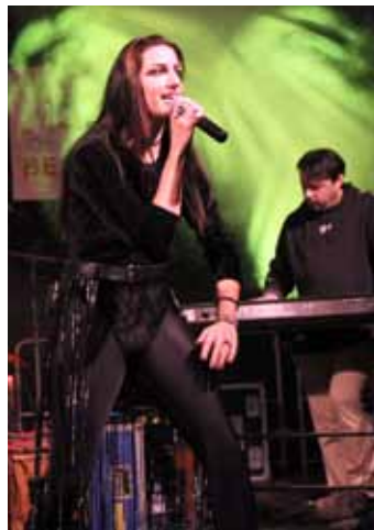
Z metalového soudku. V rámci sobotního programu se představily také dvě metalové kapely, a to Imortela (vlevo) a Rissla (vpravo).