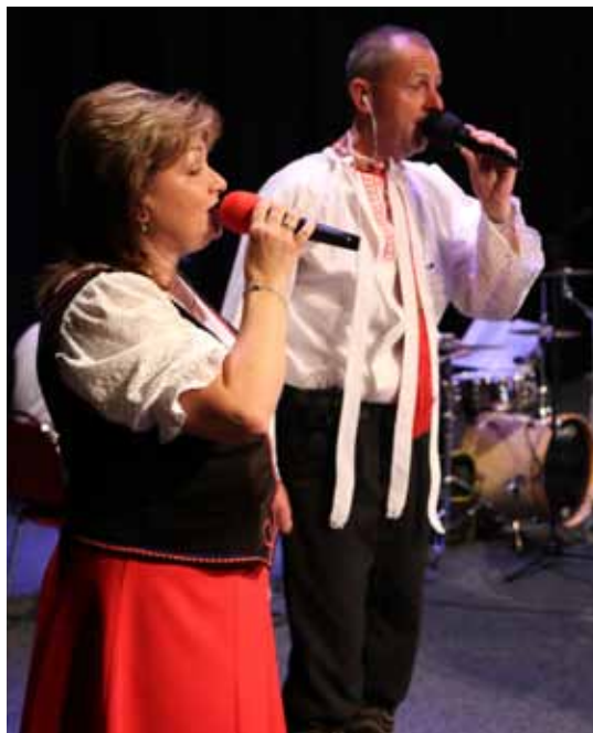
Zlatulka. Nedělní odpoledne patřilo všem milovníkům lidových písní. Návštěvníkům k poslechu i k tanci zahrála dechovka z Podluží Zlatulka .