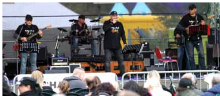
Tady a teď. Tato kapela je již stálící, která pravidelně vystupuje na otrokovických akcích. Ne jinak tomu bylo i na Michalské pouti.