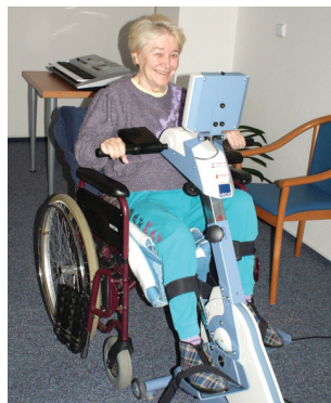
účastníků ze Senioru B společně „došlo“ až do bulharské Sofie, tedy úctyhodných 1178 km! Věk opravdu není na překážku, k této vzdálenosti totiž aktivně

Nejedná se o soutěž, vřdyt pro někoho, kdo potřebuje k pohybu chodítko nebo berle, je překonání několika metrů stejný výkon jako pro jiného několik kilometrů. Ovšem společně se podařilo třinácti účastníkům ze Senioru C za měsíc ujít a ujet vzdálenost 322 km, a symbolicky tak navštívili rakouský Linec. A 28