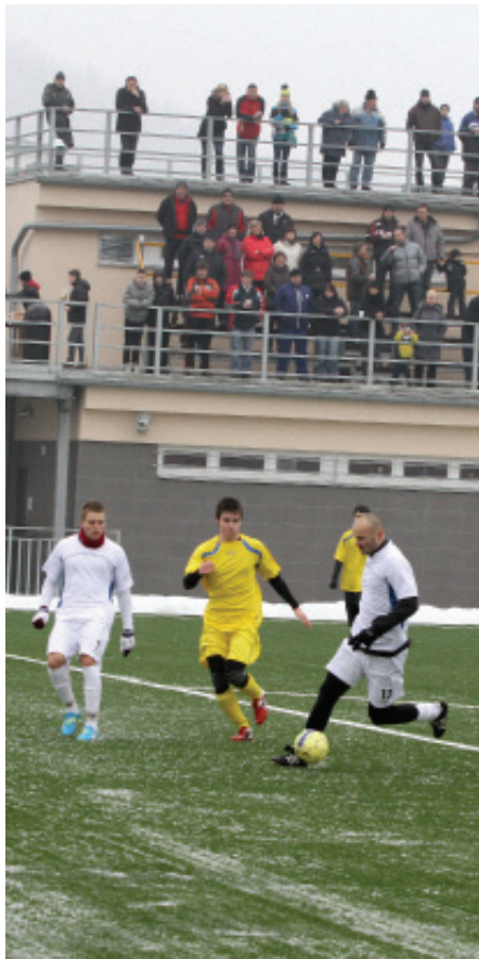
Divácky atraktivní utkání trvalo 70 minut. Padlo při něm 8 gólů.