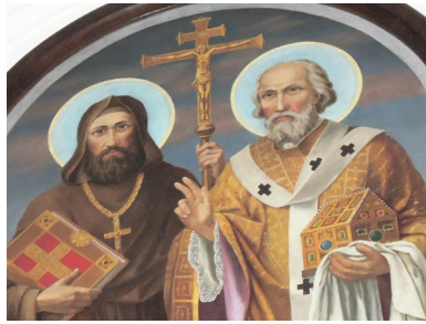
Obraz sv. Cyrila a Metoděje, který je umístěn v kapli sv. Anny v Kvítkovicích.

Také v Otrokovicích nalezneme řadu ohlasů cyrilometodějské tradice. Při vstupu do vestibulu radnice nás po levé straně upoutá malba zachycující sv. Cyrila a Metoděje; jejím autorem je akademický malíř Jano Köhler a je na ní uveden letopočet 1906. Toto dílo bylo původně umístěno na budově někdejší školy (u kostela sv. Michaela), která byla právě v roce 1906 přestavěna. Po dlouhých desetiletích v souvislosti s proměnou centra Otrokovic byla malba v r. 1992 renovována a přemístěna do nové budovy radnice, která byla o rok později předána veřejnosti.