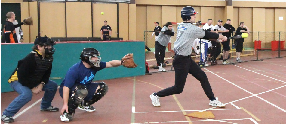
Otrokovický softballový tým (šedočerné dresy) se utkal s SK sever Brno a s MaSK Pezínok.