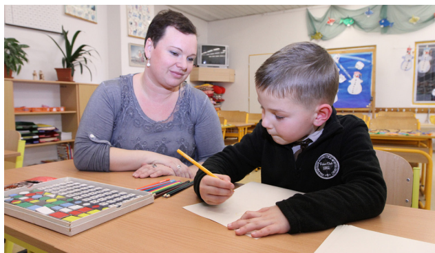
Do 1. ročníku ZŠ Tomáše Garrigue Masaryka zapsali minulý pátek také třiasedmdesát dětí.

Zapívat písničku, namalovat toho, na koho si první vzpomenu, poznat tvary, barvy a také porovnat, čeho je méně či více. Takové úkoly čekaly budoucí prvňáčky v pátek 8. února v otrokovických základních školách. Pedagogové tak hravou formou zjišťovali, jestli je dítě dostatečně vyspělé na to, aby mohlo v září nastoupit do školy. Budoucí prvňáčci by například měli zvládnout základní sebeobsluhu a jednoduché domácí práce, které jim rodiče svěří, znát zásady osobní hygieny a slušného chování, umět se deset minut soustředit na zadanou práci nebo činnost, spolupracovat s kamarády, formulovat své požadavky, mít dostatečnou slovní zásobu či správně držet tužku nebo nůžky.