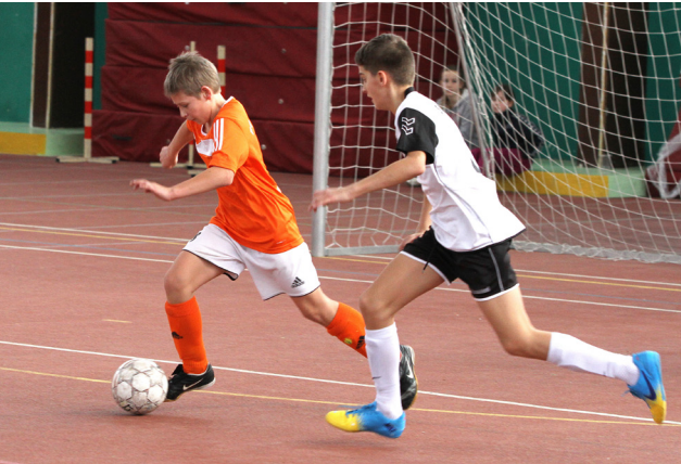
Memoriál Miroslava Hlobila: zápas týmů FC Viktoria Otrokovice (v oranžovém) a SK Louky.

Bohatým sportovním životem žila v lednu městská sportovní hala Otrokovice. Kromě pravidelných tréninků se tam konal i softballový turnaj juniorských a mužských družstev, II. otevřené mistrovství Otrokovice pro atletické přípravy a žáky základních škol a také mládežnický fotbalový turnaj.