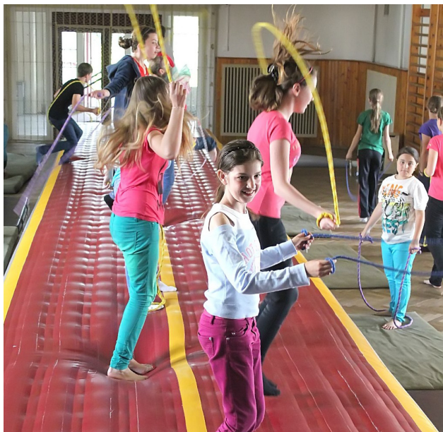
Cvičení na nafukovacím koberci airtrack v otrokovické sokolovně.