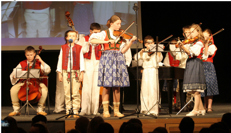
Na lidovou notěčku. Návštěvníci koncertu pro Sdružení Šance viděli tradiční i moderní vystoupení. Koncert zahájila cimbalová muzika ZUŠ Otrokovice.