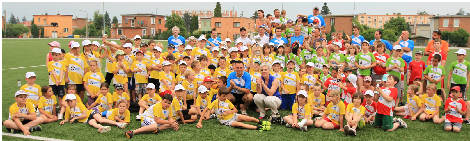
To jsme si zařadili! Školáci ZŠ Máněsova mají žluté dresy, ZŠ TGM červené a ZŠ Trávníky zelené. Radost jim udělal pohyb, ale i medaile a poháry, které dostali.