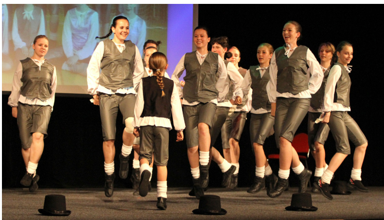
Oliver Twist. Aerobic Tlumačov předvedl skladbu Oliver Twist, se kterou se tým umístil na bronzové příčce DĚTI FITNESS aneb Sportem proti drogám v Praze.