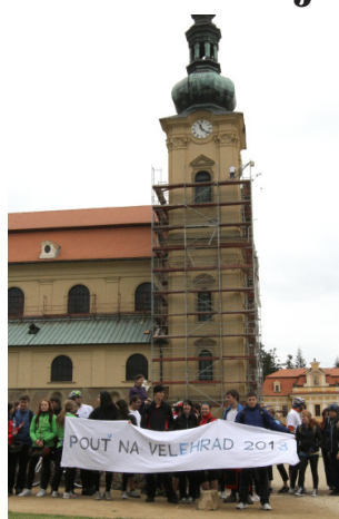
Otrokovičtí gymnazisté vyrazili na Velehrad na kolech.

„Naši výtvarníci soutěž obleslali animovaným filmem, který ve své kategorii neměl