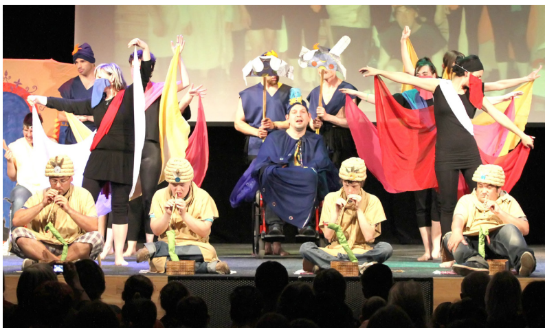
Tisíc a jedna noc. Do Orientu přepravila návštěvníky akce otrokovická Naděje. Ta se skladbou Tisíc a jedna noc slavila úspěch i v květnové soutěži DĚTI FITNESS aneb Sportem proti drogám v Praze. Získala 1. cenu v kategorii Handicap.