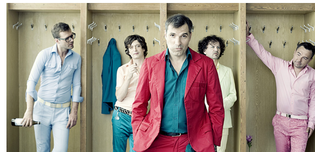
MIG 21 přijede do Otrokovice.

Kvítkovice u kaple sv. Anny „Havajský park“ 9.00–17.00 Řezbářské sympozium 10.00–12.00 Dětský pořad J. Hadaše 9.00–17.00 Přehlídka hasič-