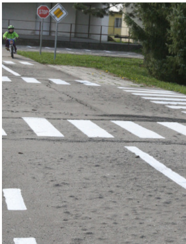
Povrch dětského dopravního hřiště je samý hrbol, rekonstrukci si zaslouží.

Radnice byla úspěšná také při získávání dotací. „Aktuálně pracujeme na projektech s potenciálem získání dotací v souhrnné výši 102 200 000 korun.