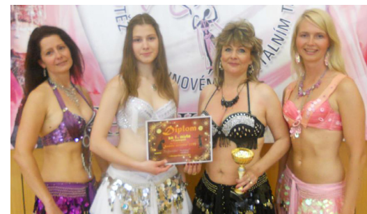
Tanečnice s oceněními z Uherského Ostrohu.