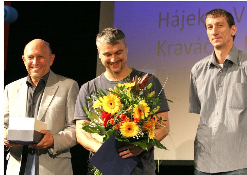
Starí páni nezaváhali. Nešťěstí nechodí po horách, ale po lidech. Jeden z hráčů Starých pánů SK Baťov 1930 byl v nesnázích, ostatní mu zachránili život.

28. říjen je dnem, kdy si připomínáme vznik samostatného československého státu. Pietním aktem u Pomníku padlých na náměstí 3. května a poté v Kvítkovicích si ve středu 23. října tento významný den připomněli nejen nejvyšší představitelé města.