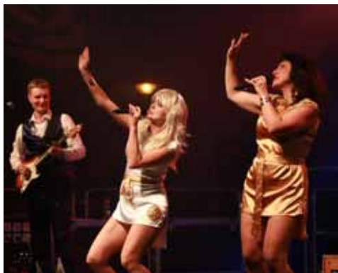
Jako originál. Skvělé moravské uskupení Abba Rock Show představilo ty neznámější hity legendární švédské kapely.