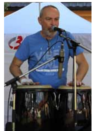
Nejenom k poslechu. Hudební program v Kvítkovicích doplnily kapely Jazzbook (vlevo) a Cestující hudba (vpravo).