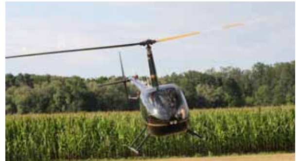
Trocha adrenalinu. Letošní novinkou, kterou si mohli návštěvníci festivalu užít, byl vyhlídkový let vrtulníkem nad Otrokovicemi.