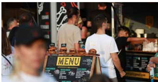
Něco na zub. Sobotní gastrofestival potěšil i milovníky mezinárodní kuchyně.