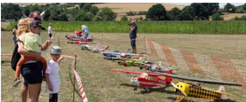
Nejenom pro děti. Letečtí modeláři již tradičně představovali v Bělově svou sbírku.