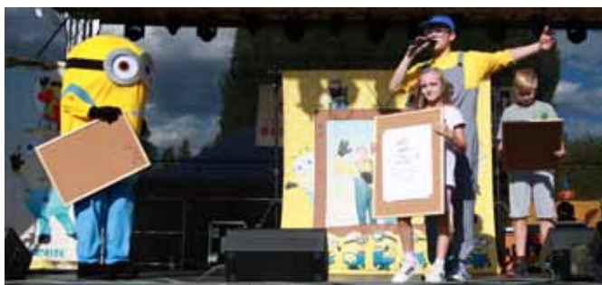
Pro děti. Nedělnou součástí slavností byl také program určený dětem. V sobotu pobavil nejmenší diváky KAMARÁD WIKI s Mimoní (vlevo), v neděli hudební vystoupení Pískomil se vrací.