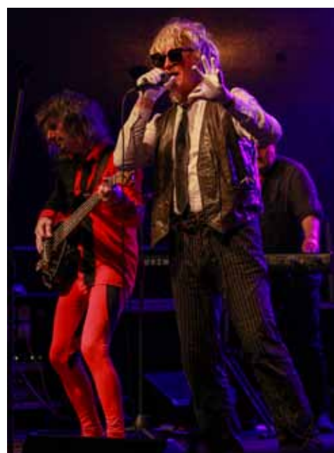
Pro fajnšmekry. Páteční program zakončila kapela Pražský výběr tribute s největšími hity „Výběru“.