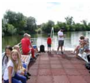
Na lodi. Návštěvníci festivalu mohli absolvovat projížďku na lodi Morava.