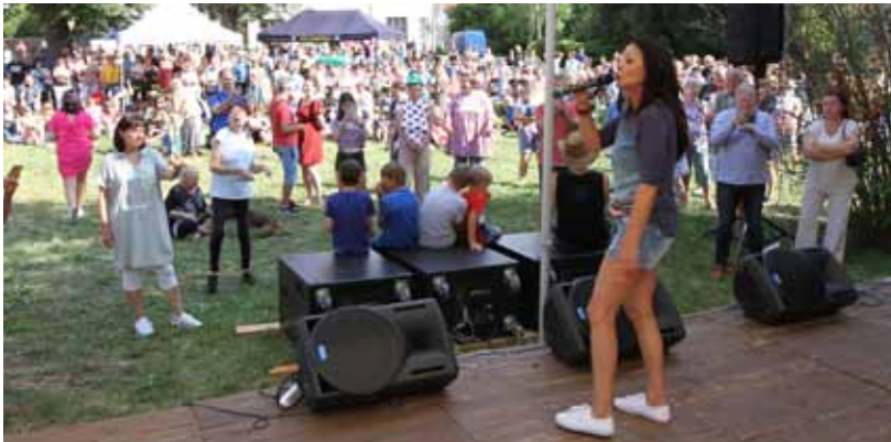
Plné náměstí. Takovou jízdu Kvítkovice snad ještě nezažily. Postarala se o ni v sobotu odpoledne česká zpěvačka Heidi Janků, která svou energií strhla všechny diváky.