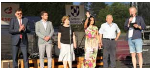
Zahraniční návštěva. Na festival zavítali také zástupci partnerských měst z maďarského Vácu a slovenské Dubnice nad Váhom a Partizánského.