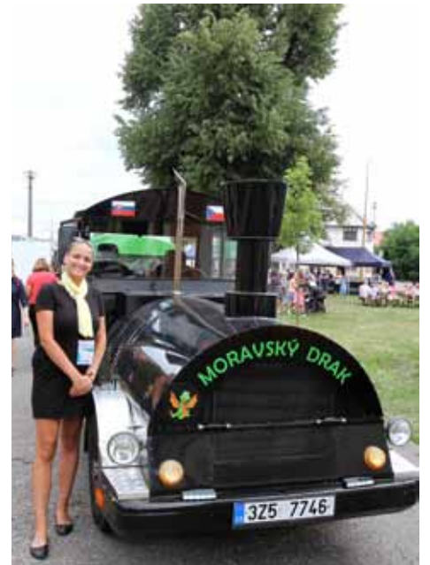
Oblíbená doprava. Ať už se návštěvníci slavností chtěli podívat na přistaviště, na hudební vystoupení do Kvítkovic, nebo ke Společenskému domu, či si udělat výlet na výstavu modelů letadel v Bělově, mohli využít dopravy speciálního vlaku Moravský drak.