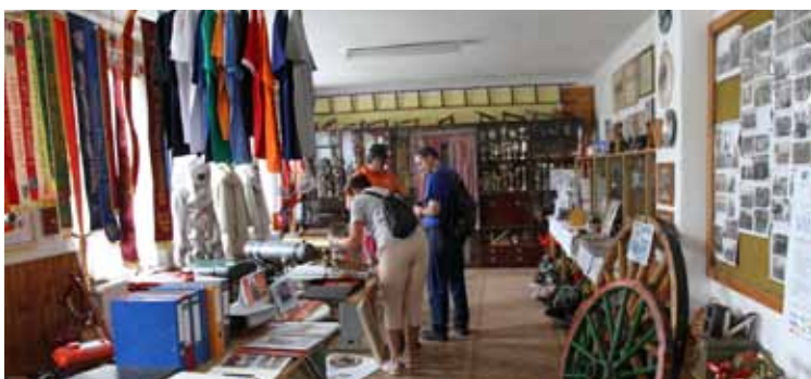
Za historií. V Kvitkovicích byla zdarma přístupná mini historická síň tradic SDH.