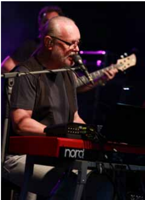
Legenda. Bezspornu největší letošní hvězdou třídních Otrokovických letních slavností byl legendární textař, skladatel, geniální muzikant a spoluzakladatel kapely Elán Vašo Patejdl. Na jeho vystoupení se přišly podívat stovky diváků.