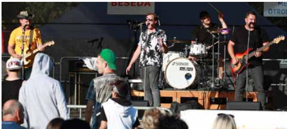
První. Třídenní hudební festival odstartovala v pátek moravská rock-popová kapela Scarlet Rose.