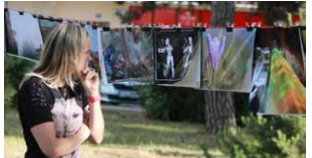
V parku. Kromě hudebních zážitků se návštěvníci parku u Společenského domu mohli pokochat výstavou Fotoklubu BESEDA.